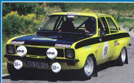
● Opel Ascona Groupe 2