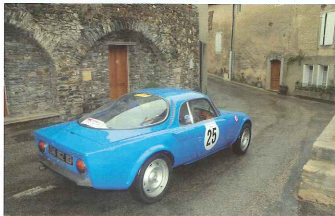
Les passages étroits dans les villages : toute la magie des Cévennes.

faute sur ce secteur et passent en tête pour 1 petit point devant Saintouil-Morel. L'ultime étape ne changera rien à la donne, les deux équipages de tête y font jeu égal ! Derrière, l'ordre a peu évolué. Guignard et Parnot sont à égalité finalement et Testud est parvenu à garder une petite avance. Lefevre se retrouve loin, à la 13e place ! ■