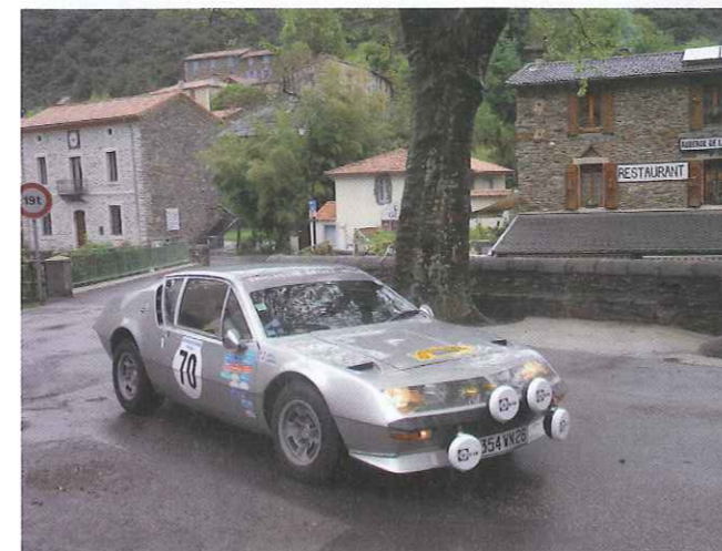
Claude Saintouil-Morel (A 310-1600)