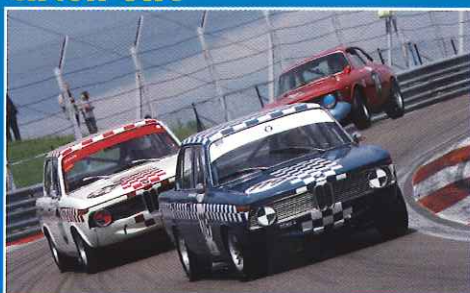
● Grand Prix de l'Age d'or