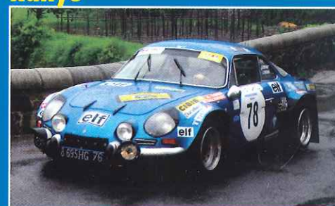
● Critérium Cévennes Historique