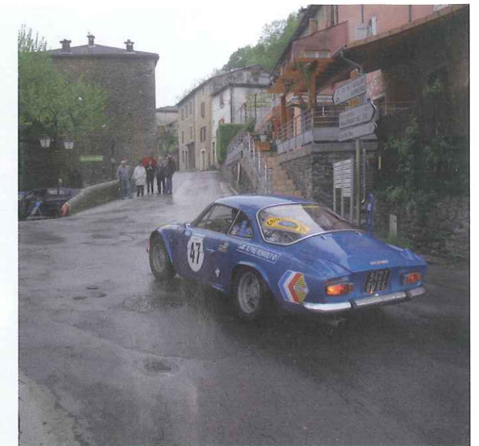
Cy. et Ch.Gascht (A 110-1300)

On refait le match ! Samedi matin, lors de la pre-