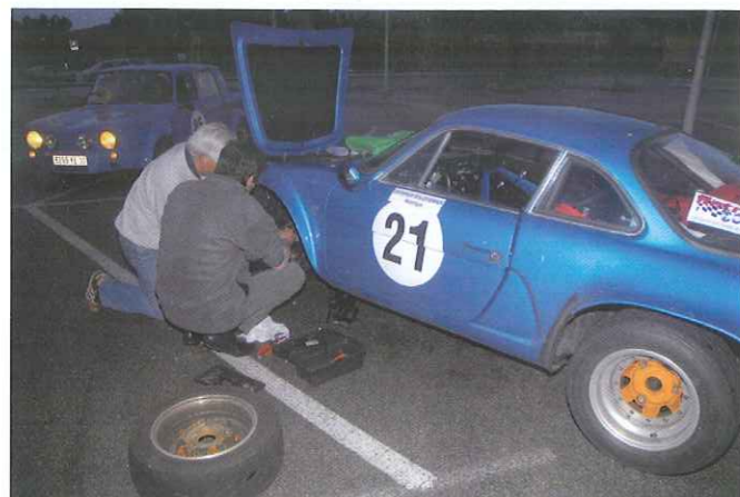
L'ambiance, comme à l'époque