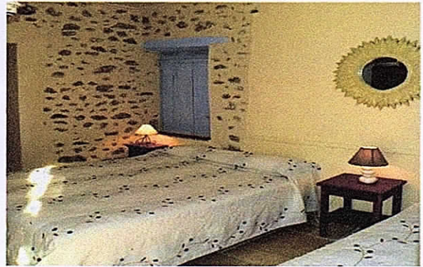
Chambre Hôtel l'ORONGE