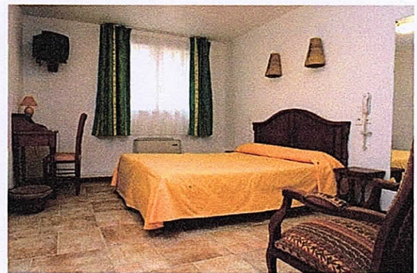
Chambre Les 4 SOURCES

Dotée d'une belle renommée , cette épreuve attire des Autos et Pilotes et copilote qui ont marqués Années 1960 à 1980