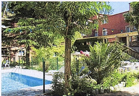
Hôtel Les 4 SOURCES