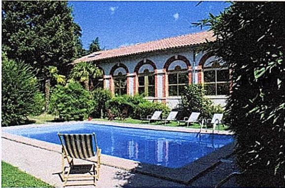
Hôtel Les BELLUGUES